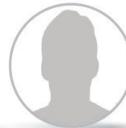
NINGUNO / BLANCO