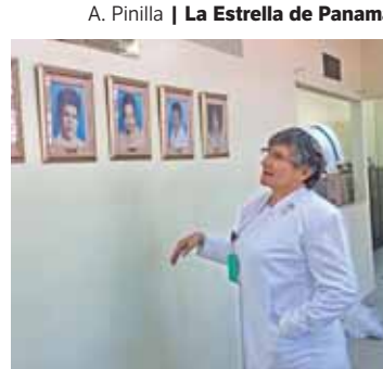
A. Pinilla | La Estrella de Panamá