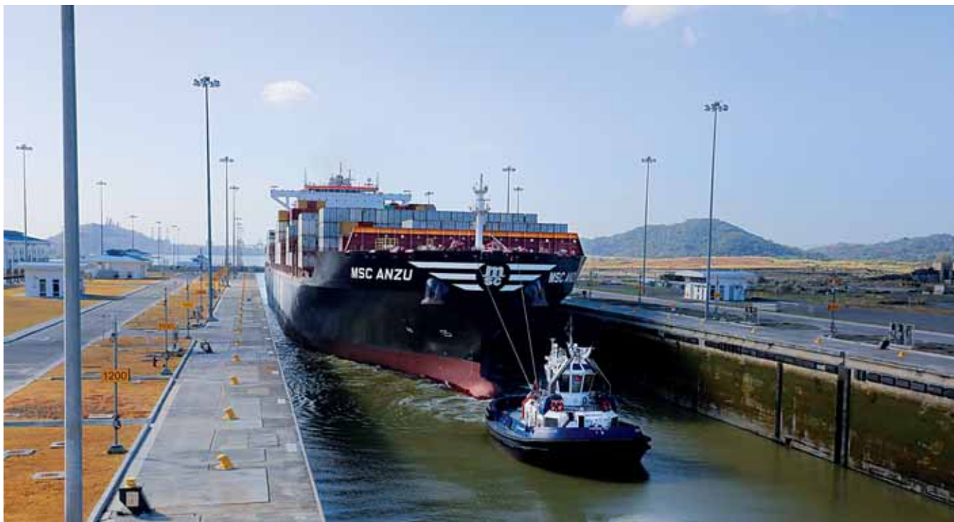
Daniel González | La Estrella de Panamá

Con el 'MSC Anzu', de 299 metros de largo, el Canal registró el millar de neopanamax que han pasado por el tercer juego de esclusas inaugurado en junio pasado